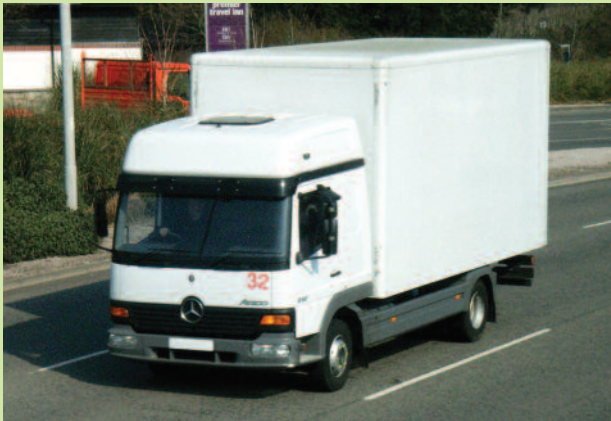
Einsparung von 16.17 % erreicht.

Fischer & Kral GmbH Co KG, Ramsauerstr. 28, 3170 Hainfeld